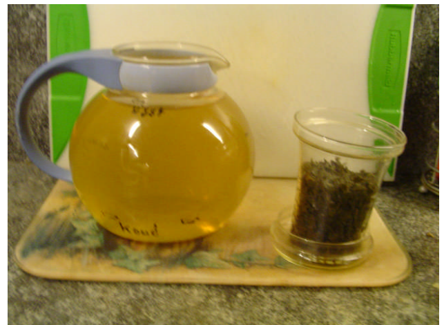
Thee kan geschonken worden en bladen kunnen voor tweede charge gebruikt worden.