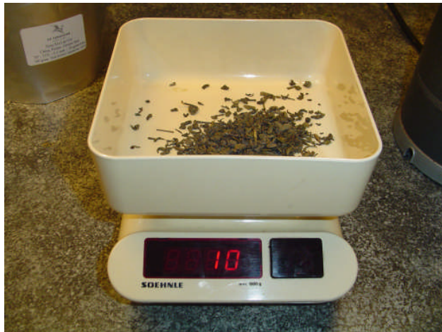
Afwegen 10 gram thee

Hieronder zie je een aantal foto's behorende bij een aantal voornoemde stappen om de groene thee volgens voorschrift en de geldende kwaliteitsnormen te kunnen zetten. Deze kunnen ter ondersteuning bij de bereidingen gebruikt worden.