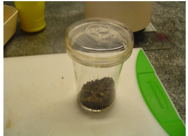
Thee in glazen zeefpotje wat bovenin theepot past