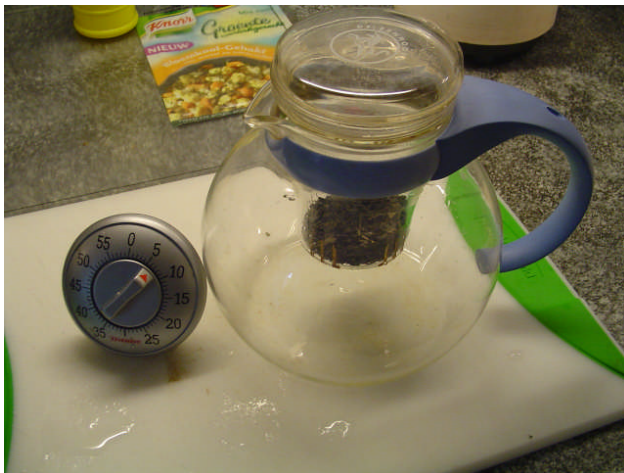
Theepot met inhoud en kookwekker