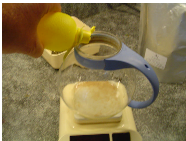
Afwegen voorgeschreven hoeveelheid citroensap.