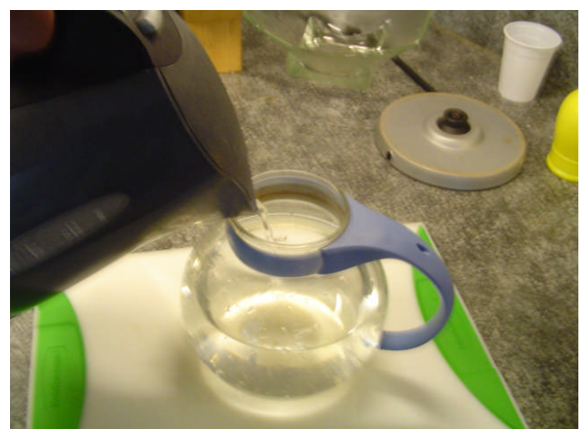
Toevoegen voorgeschreven hoeveelheid water