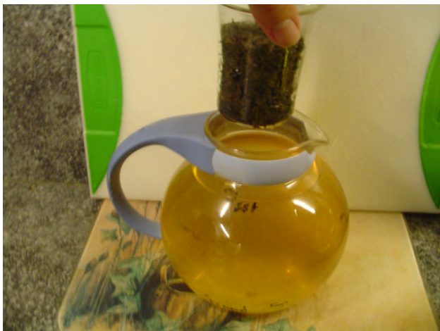
Verwijderen theeblad uit pot en thee is gereed.