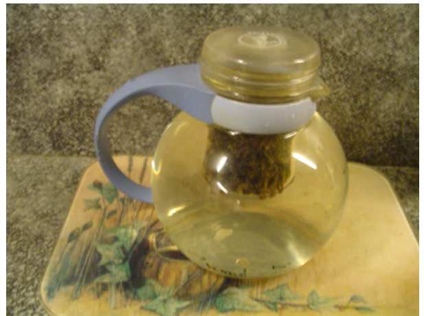
groene thee na 5 minuten trekken