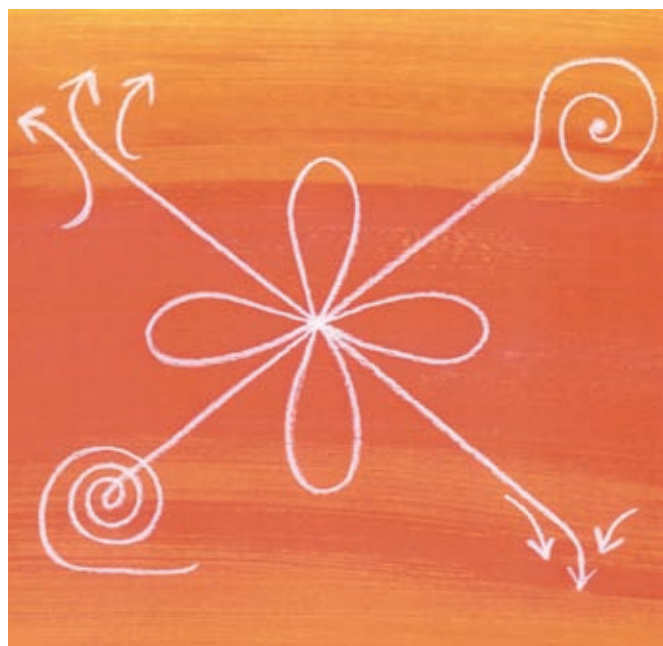
Tekening van de vier natuurkwaliteiten (gemaakt door Anja Louis)

‘En ik heb de beweging in dit systeem ingebracht, want die vond je nergens terug. Dit model maakt ook duidelijk dat wetenschap eigenlijk slechts de halve waarheid laat zien. Maar het sjamanisme bijvoorbeeld ook. Ze zijn beide waar maar met elkaar zie je pas het complete beeld. Stel dat je iemand tegenkomt met wie je jaren op de middelbare school hebt gezeten, dan praat je zo weer met elkaar verder. Want een deel van jou verandert niet. Tegelijkertijd ben je nu weer anders dan vijf minuten geleden. Het is dat vochtige deel van jou dat verandert en voortdurend verbindingen maakt. Wetenschappelijke onderzoeksmethoden sluiten nou net dat gedeelte uit. Zo kan dezelfde ziekte bij ieder een andere oorzaak hebben. Dat wordt in onderzoek niet meegenomen. Tervwijl je juist ook dat stuk vocht kunt aanspreken. En dat is precies wat we in de natuurgeneeskunde doen.’